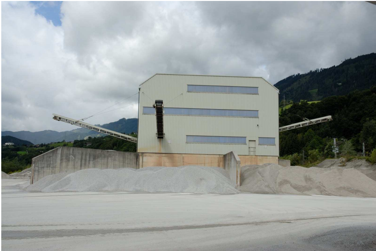
Abbildung 3: Wasch- und Klassieranlage mit Schwerterwäsche