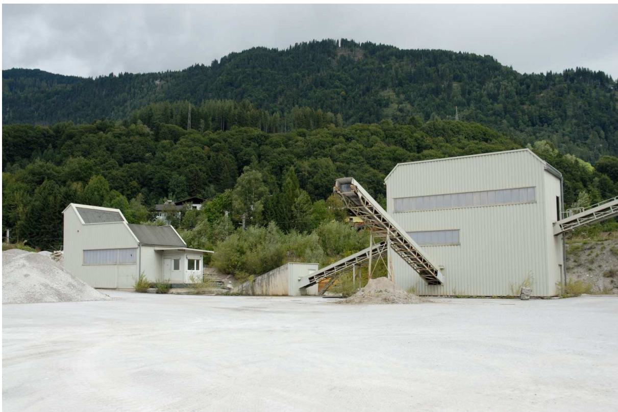
Abbildung 4: Brecherhaus (links) und Vorsortierung