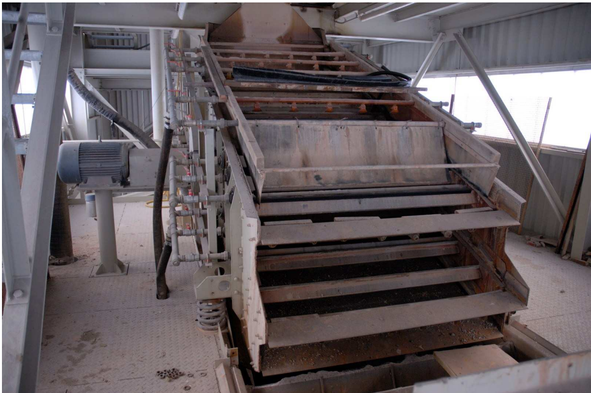
Abbildung 10: Siebmaschine 16/40/2,5