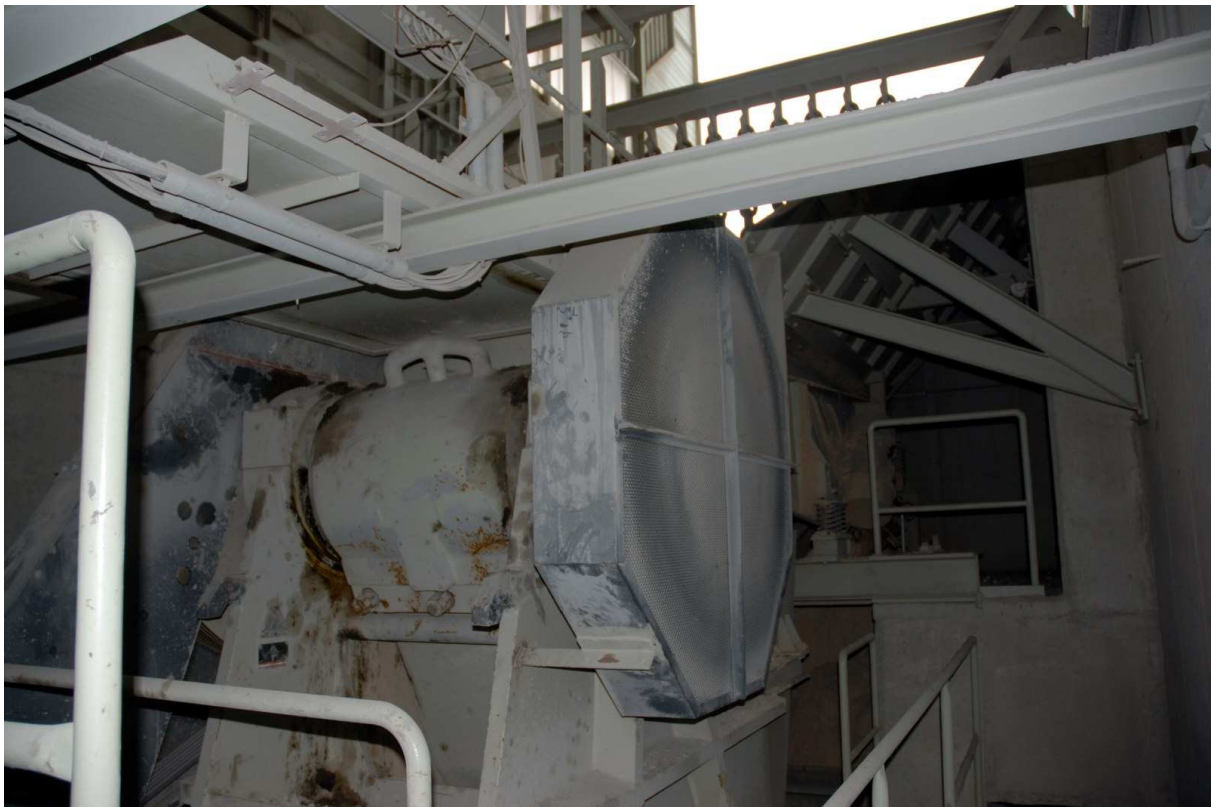
Abbildung 6: Backenbrecher MFL STE 10070