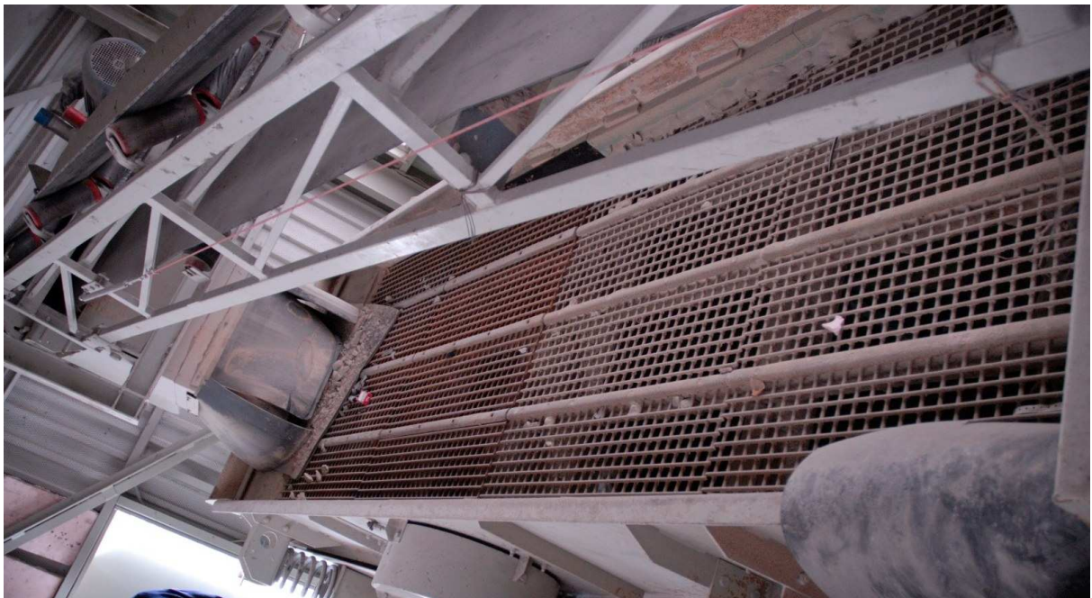
Abbildung 8: Vorsiebmaschine MFL GA 1600x4000x1