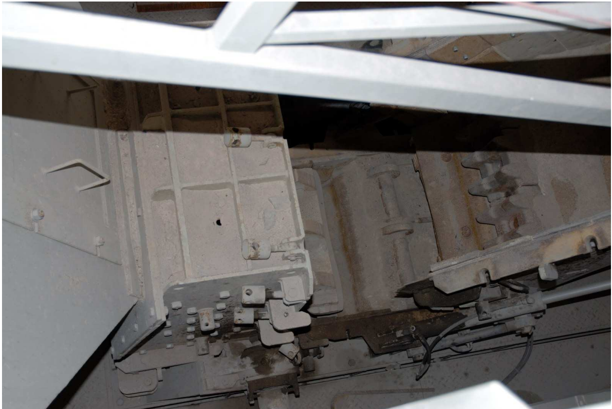
Abbildung 7: Prallmühle MFL VX 8-08-4 BMT