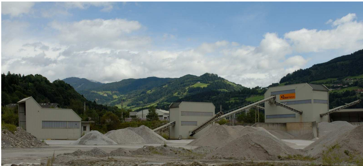
Abbildung 2: Übersichtsfoto