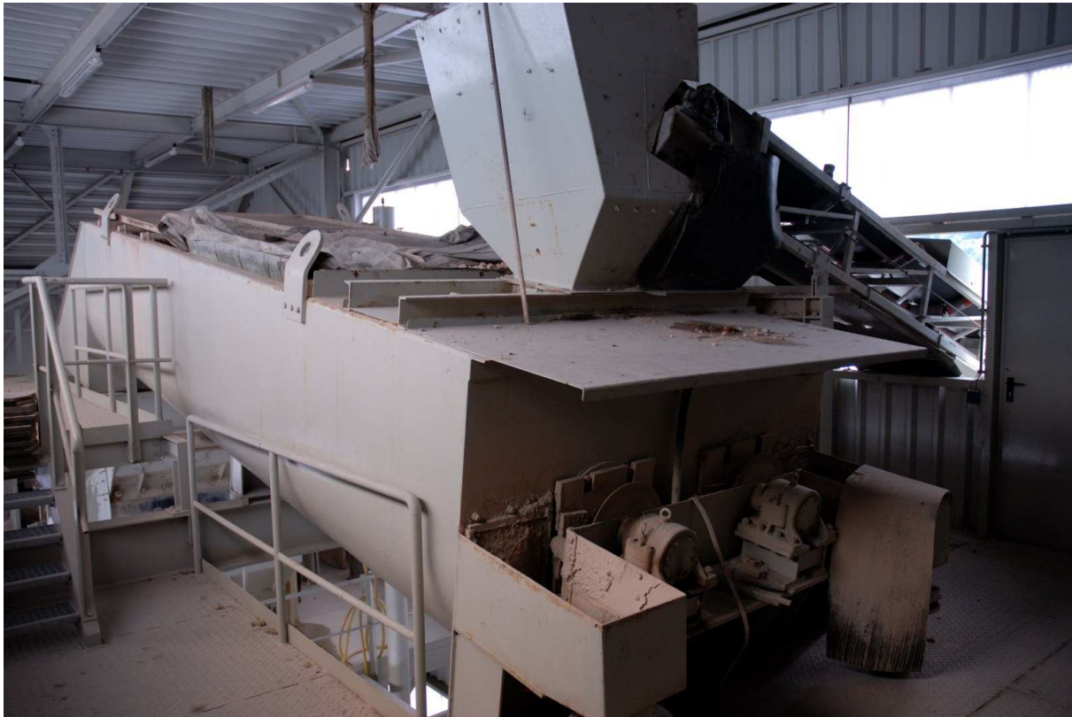
Abbildung 9: Liebchen Schwerterwäsche