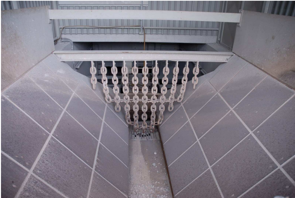
Abbildung 5: Aufgabebunker